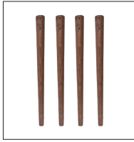
4 Adet Masa Ayağı