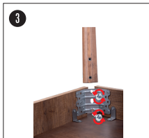
Masa ayaklarını, bağlantı noktalarına gelecek şekilde vidalayınız.