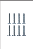
8 Adet Bağlantı Vidası