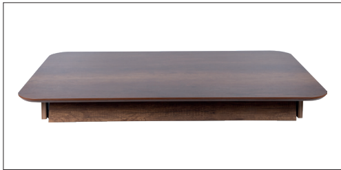
1 Adet Masa Tablası