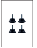
4 Adet Ayak Pabuçu