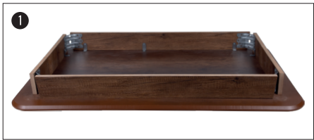
Masa tablasını yere gelecek şekilde yatırınız. (Çizilmesini için zemine yumuşak bir bez seriniz.)