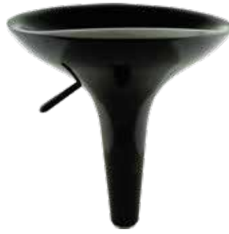
[6] SANDALYE OTURMA ALANI